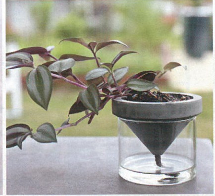
水泥自動吸水花器 (小)，配吊竹梅，自動吸水設計讓泥土保持濕潤，但又不會積水。$160