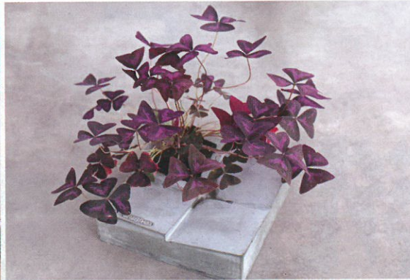
方形水泥花器，配野草「紫蝴蝶」，粗生但紫得漂亮。$240 (水泥盆)、$40 (植物)