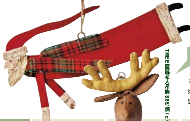
TREE 聖誕老人吊飾 $65/個 (c)

地址：中環德輔道中173號南豐大廈1樓1號舖 電話：2263 3153 網址：www.greencomon.com