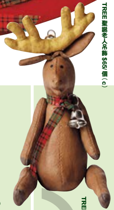
TREE 迷你駝鹿掛飾 $65/個

聖誕怎少得聖誕老人和鹿仔！環保家具精品店 TREE 的飛天聖誕老人吊飾，以回收錫再造，有拿著星星、聖誕襪及叮噠三款造型；而迷你駝鹿掛飾則以回收帆布麵粉袋以人手再造，有啡、米白及灰藍色選擇，可與聖誕老人一起掛在聖誕樹上，或讓它坐在桌上當名片架。