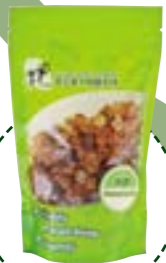
每包可食十次以上，好抵買。

而有售桃膠的菁云負責人就說，桃膠有和氣益血、腸胃保健及美容等功效，由於製作過程中沒有加入化學成分，可當作啫喱的天然替代品，令糖水的口感更豐富，亦可配以芡汁作一味菜餚；不過論到膠質，還是雪蓮子較豐富。