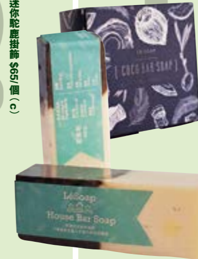
Le Soap 家事皂 $140/80g (d)