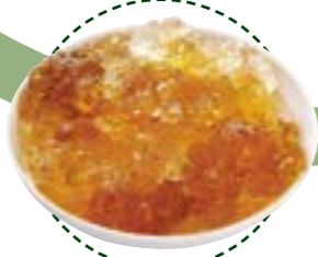
浸泡一晚後會發大1-2倍。