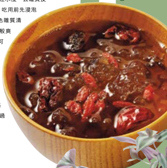
菁云桃膠 $65/250g (a)