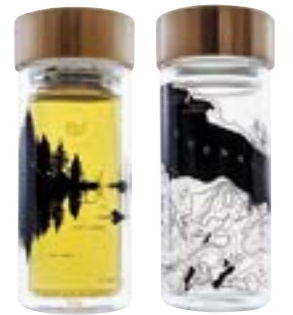
AQUAOVO Therm-O 隔熱玻璃樽 $259/每個500ml (d)

一向推動環保購物的唐寧，近期聯同其經理人推出品牌 Le Soap，自家設計可洗蔬果、碗碟、衣物的家事皂，以及洗面用，選用所羅門群島有機冷壓初榨椰子油的椰皂，全以手工製，快買一塊跟女神一起崇尚自然！