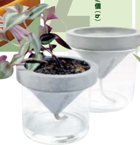
Greenology 水泥自動吸水花器 (小/大) $160/個 (b)